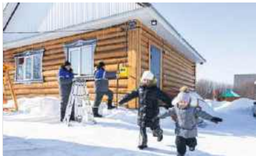
ГЛАВНЫЕ ПРЕМЬЕРЫ ГОДА

№ 20 (34). Декабрь 2025 г. | Корпоративное информационное издание ООО «Газпром межрегионгаз Уфа» и ПАО «Газпром газораспределение Уфа»