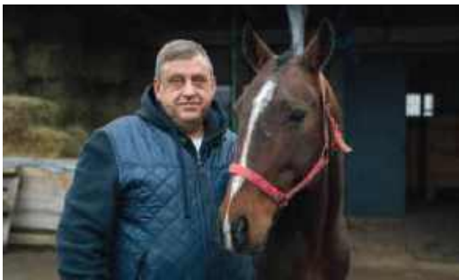
НА СКАЧКАХ И НА СЛУЖБЕ...