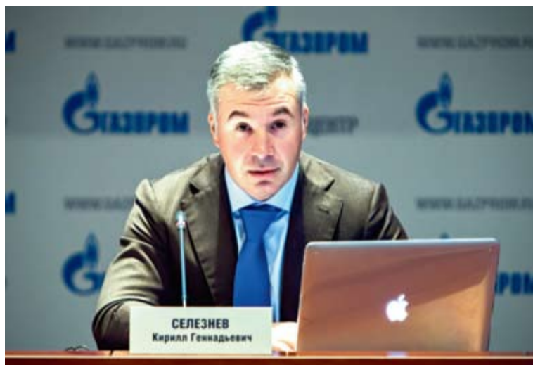
Кирилл Селезнев: «Рост задолженности и отставание в подготовке потребителей к приему газа препятствуют газификации России»

Одновременно «Газпром» принимает меры, направленные на увеличе-