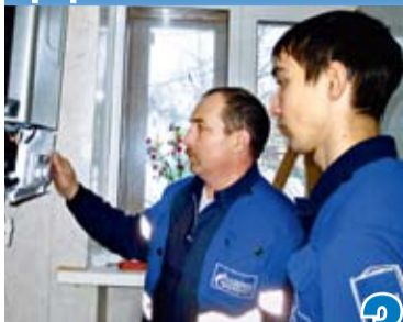
КОМФОРТ И ВЕСОМАЯ ЭКОНОМИЯ