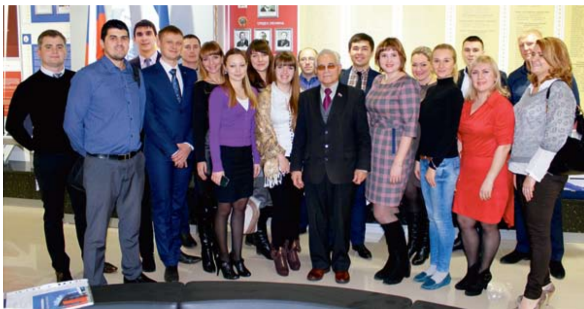
Члены Молодежного совета в музее Общества нашли множество вдохновляющих примеров самоотверженного труда нескольких поколений газовиков

Совет прилагает значительные усилия для защиты социально-экономических интересов юношей и девушек, для самореализации работников