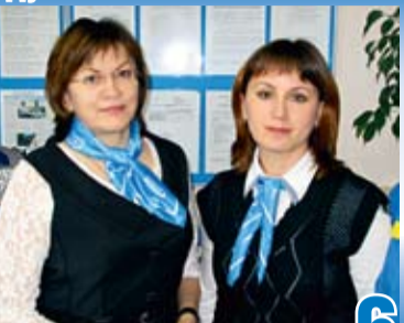
ХРАНИТЕЛИ ГОЛУБОЙ ЭНЕРГИИ