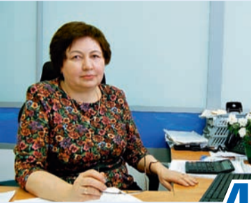
Пример полной самоотдачи