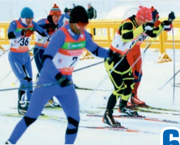
Дружба крепнет в состязании