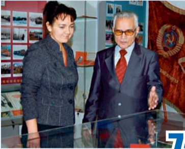
Каждый день полон забот