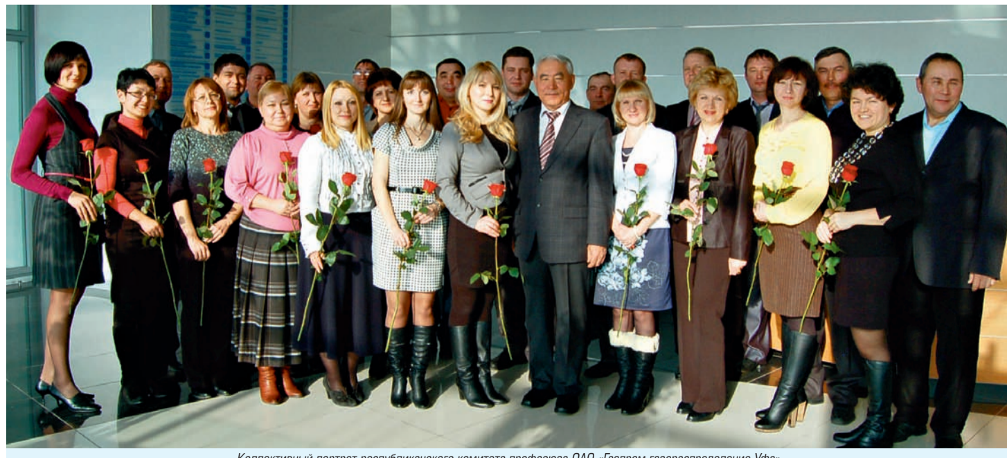
Коллективный портрет республиканского комитета профсоюза ОАО «Газпром газораспределение Уфа»