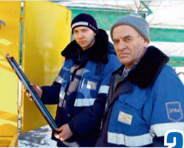
Новое качество жизни