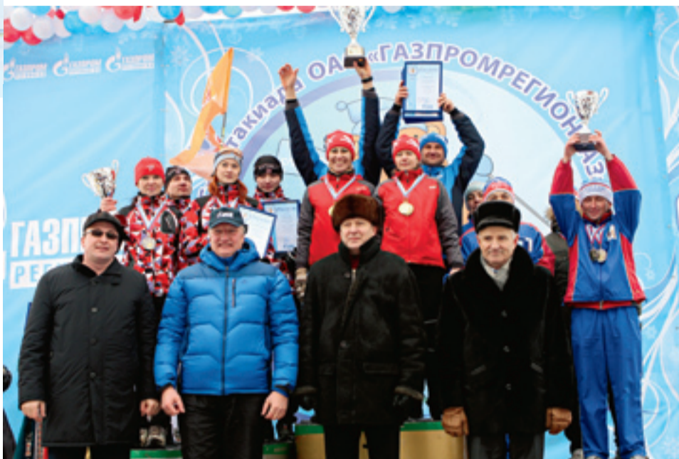
«Наша первая зимняя Спартакиада удалась!» Руководители, организаторы мероприятия и победители эстафетных гонок

В прошедшей в Уфе I зимней Спартакиаде ОАО «Газпромрегионгаз» приняли участие 26 команд со всех уголков России