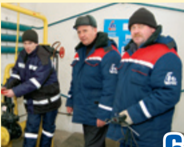
Надежные в людях поруки стр. 6