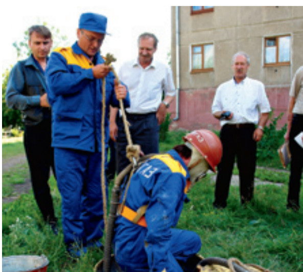
Слесари АДС «Учалыгаза» проверяют колодец