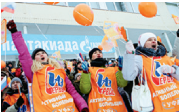
Сотни болельщиков в оранжевой форме два дня энергично поддерживали спортсменов

Ну что ж, в добрый путь, зимняя Спартакиада! До новых встреч!