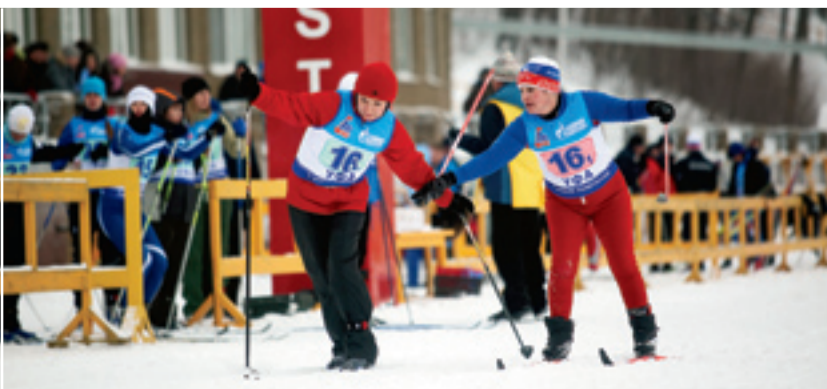
Передача эстафеты – большое искусство