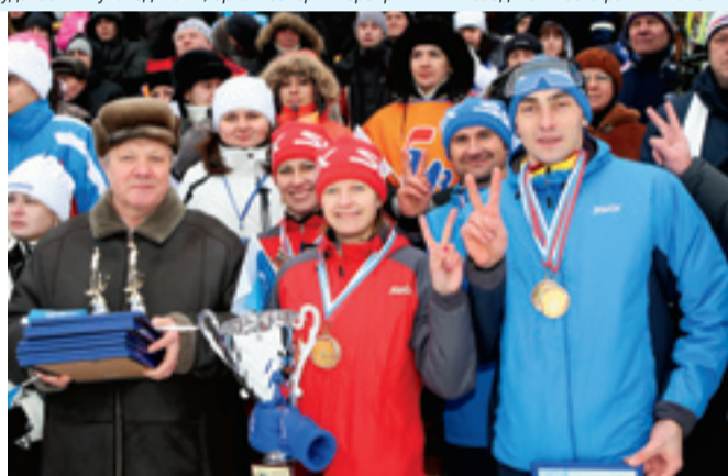
Великолепная команда «Смоленскоблгаз» – победитель спартакиады

Так завершился первый соревновательный день зимней Спартакиады ОАО «Газпромрегионгаз». Итог очевиден: команда ОАО «Смоленскоблгаз» на старте Спартакиады безоговорочно захватила лидерство – 8 очков. На втором месте сборная команда ОАО «Газ-Сервис» – 11 очков. Замыкает тройку лидеров ОАО «Чувашсетгаз» – 13 очков.