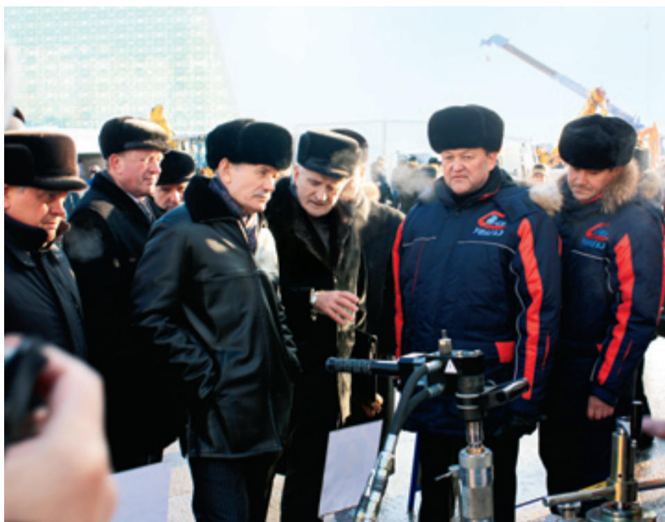
Руководством республики была дана высокая оценка готовности Общества к локализации и ликвидации возможных аварийных ситуаций на газовых сетях республики

28 января 2011 года в уфимском Конгресс-холле прошло совещание с участием Президента РБ Р.З. Хамитова по теме «Стратегия развития ЖКХ в Республике Башкортостан»