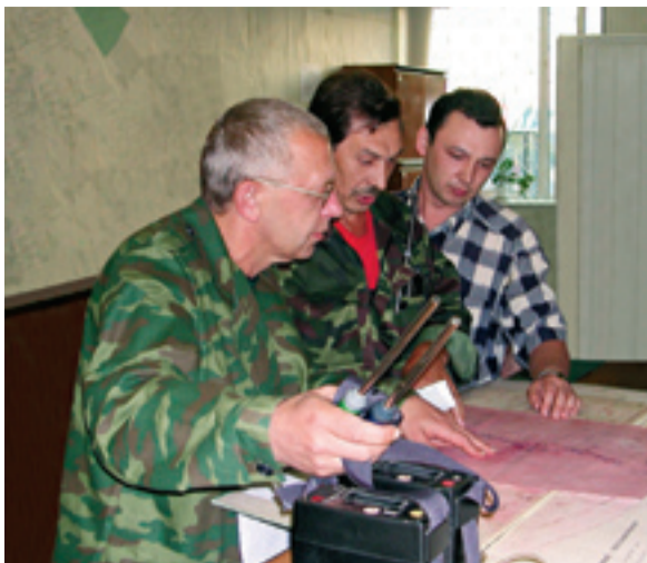
В АДС «Уфагаза» идет обсуждение плана мероприятия