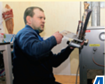
Дело мастера боится стр. 4