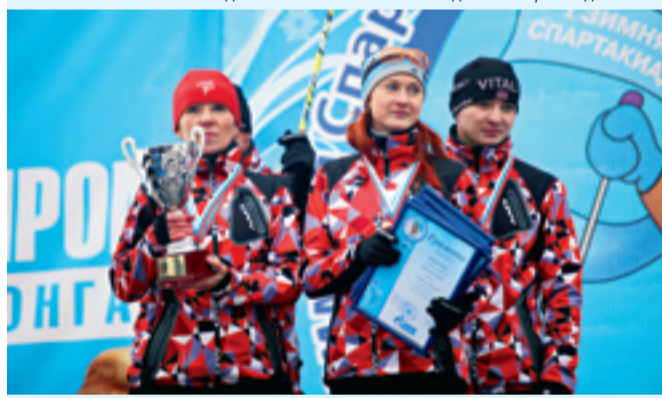
Команда ОАО «Газ-Сервис» – серебряный призер

Но на этом программа дня спортивного форума не закончилась. После ужина организаторы провели для участников соревнований экскурсию по вечерней Уфе. Гости столицы увидели главные достопримечательности города, узнали много нового и интересного.